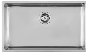
水槽 bowl KE Filotop